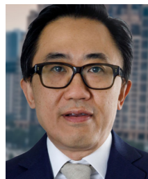
Ignatius Tong Asia-Pacific EY-Parthenon Leader

2014年にEYに参画。ストラテジー・アンド・トランザクションのグローバル消費財・小売りセクターリーダーおよびAmericasのコーポレート&成長戦略リーダーを経て、2021年、EYパルテノン のグローバルリーダーに就任。