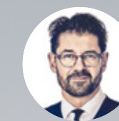
Petr Šimůnek Forbes